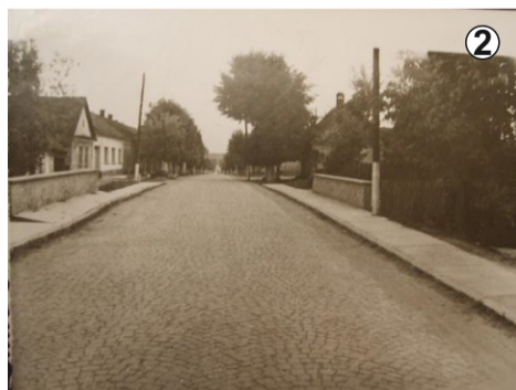
Pod zidărie peste Pr. Bozovici - inițial