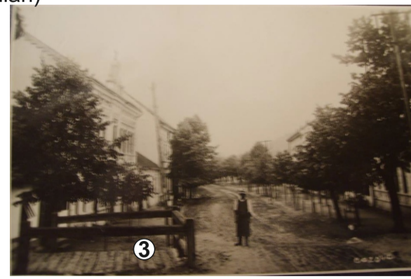
Poduț peste Og. lui Măgădan