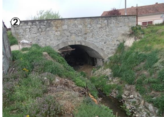
- actual, lărgit