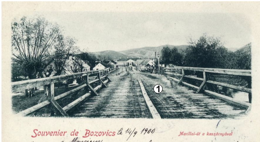
„Podul Mare“ peste Miniș - inițial de lemn (vedere spre cazarmă)