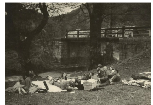
Pod peste Tăria la Poneasca (lemn)