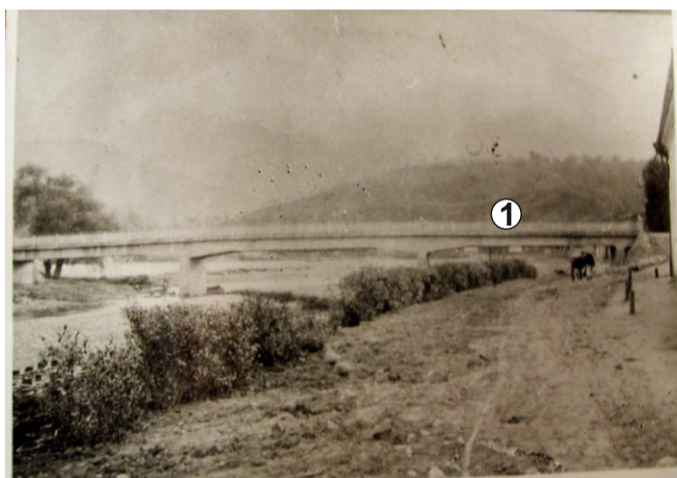
Refacere „Podul mare“ din beton cu balustrade metalice 1911 (ing. italian)