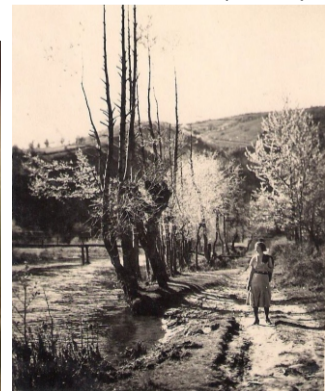
Punte peste Miniș spre moara Curpanița