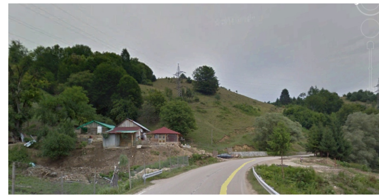
2.3. Sălaș cu terasamente instabile și posibile dezvoltări turistice