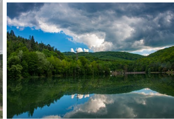
Lac acumulare Gura Golumbului pe Râul Miniș