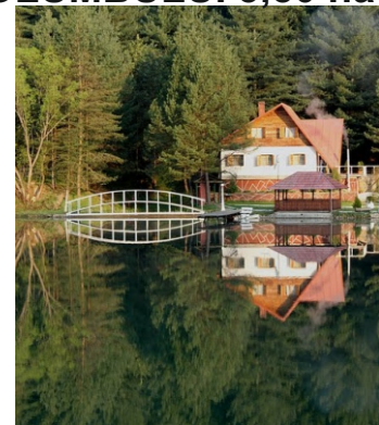
Casă de vacanță pe mal aparținând de UAT Oraș Anina