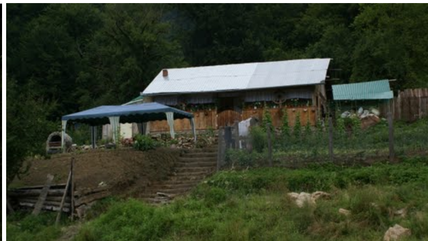
TR. 1. Valea Minișului- UAT Oraș Anina 7,5 ha