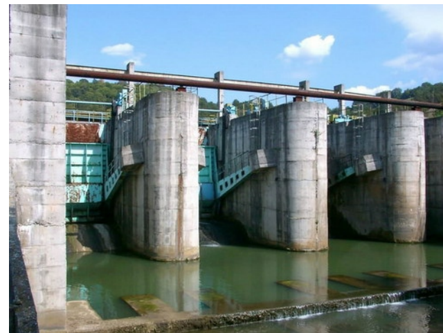
TR.2.1. CHEMA GURA GOLUMBULUI