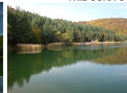
TR.2 GURA GOLUMBULUI 3,50 ha