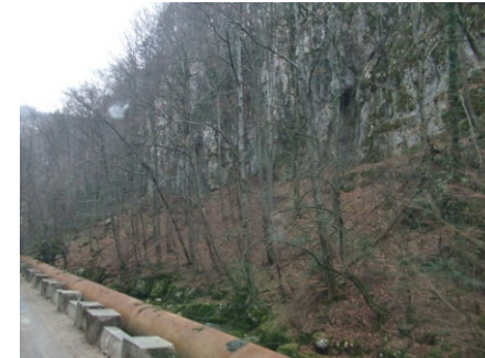
DJ 57B în Cheile Minișului și traseu conductă aducțiune apă spre CHEMA Poneasca