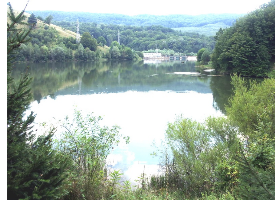
Lac Gura Golumbului și MHC Miniș