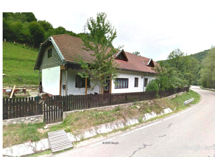
Canton silvic Cârșa