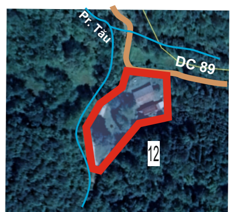
Tr.2.5. 0,78 ha